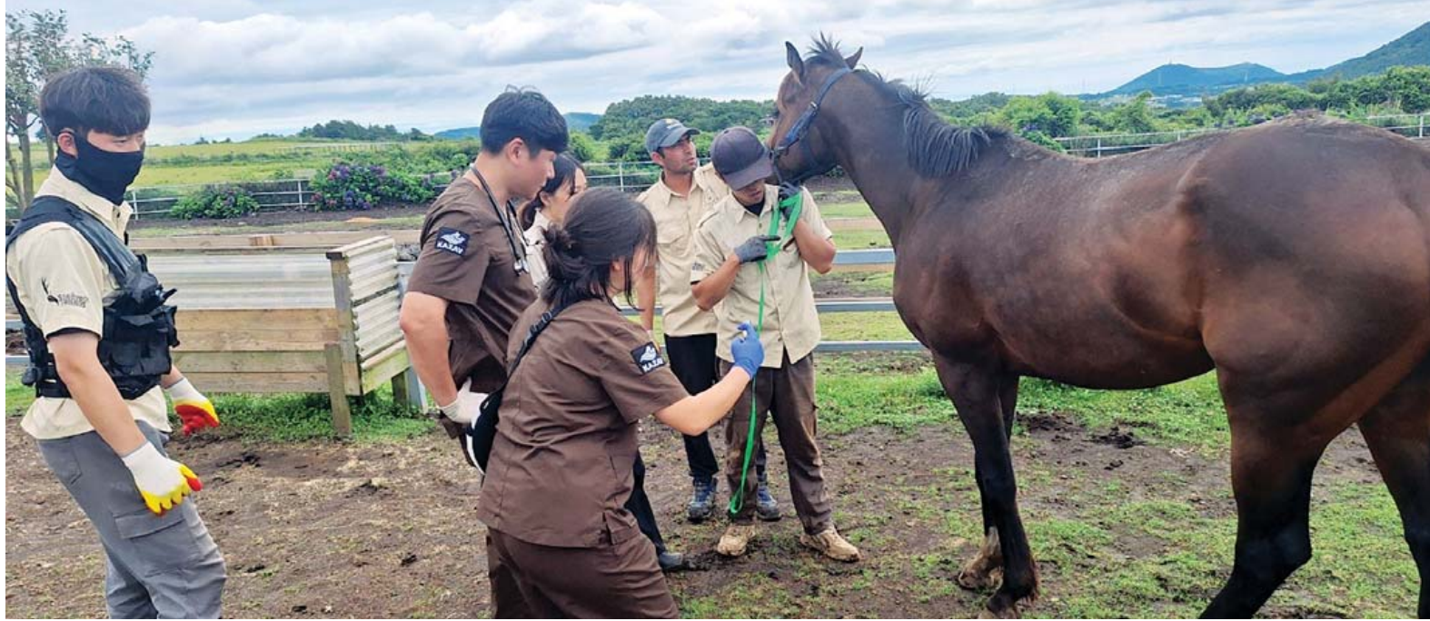
광주시 우치동물원 소속 수의사들이 지난 23일부터 이틀간 제주도 새별프렌즈, 제주자연생태공원, 한림공원, 고하의 정원, 스마일러펫 등 제주지역 동물원 5곳을 대상으로 '찾아가는 거점동물원 설명회'와 전문진료를 실시했다.

우치동물원 진료팀은 제주지역 동물원 5곳을 방문해 조류, 초식동물, 파충류, 곰과 동물 등을 대상으로 건강검진과 임상 진료를 진행했다. 아울러 질병 예방 및 치료 방안에 대한 전문 의료