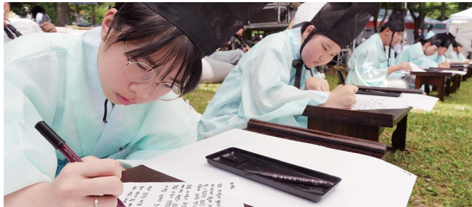
도도 입고...동구인문축제 '무등생각' 개최 광주 동구 무등산 인문축제 '무등생각'이 개최된 지난 13일 '생각'을 주제로 펼쳐지는 시 백일장에 참가한 청소년들이 글을 써내려가고 있다.