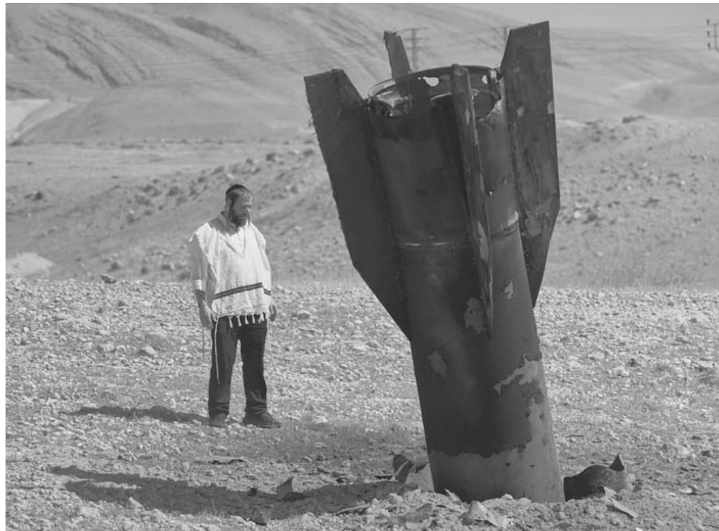
8일(현지시간) 요르단강 서안 지구 예리코 인근에 떨어진 이란 미사일 잔해를 한 남성이 살펴보고 있다.

그러나 트럼프 대통령의 만류에도 이스라엘은 전날 헤즈볼라의 핵심 거점인 레바논 수도 베이루트의 남부 외곽 다하예를 공습했다. 이에 반발한 이란은 베이루트 공습에 대한 보복 조치라며 이스라엘 북부를 겨냥해 탄도 미사일 11발을 발사했고, 이스라엘도 곧바로 이란을 향해 반격을 가했다. 트럼프 대통령이 종전 협상 판에서 "내가 모든 결정을 내린다"고 주장하고, "이스라엘과 이란은 즉각 발포를 멈춰야 한다"고 요구한 이후 이날 양측의 무력 충돌은 일단 멈춘 상황이다. 하지만 이번 교전은 네타냐후 총리가 언제든 독자적인 행동에 나설 준비가 됐음을 다시 한번 보여줬다고 가디언은 지적했다. 트럼프 대통령은 미국과 이란이 체결하려는 종전 협상이 차질을 빚지 않도록 이스라엘과 이란 간 교전의 불씨를 억제하려고 했다. 그러나 이스라엘의 보복 공습을 앞두고 트럼프 대통령은 한발 물러섰고, 이는 전쟁에 대한 그의 통제력 약화를 의미한다고 미 일간 월스트리트저널(WSJ)은 진단했다. WSJ이 인용한 당국자들에 따르면 트럼프 대