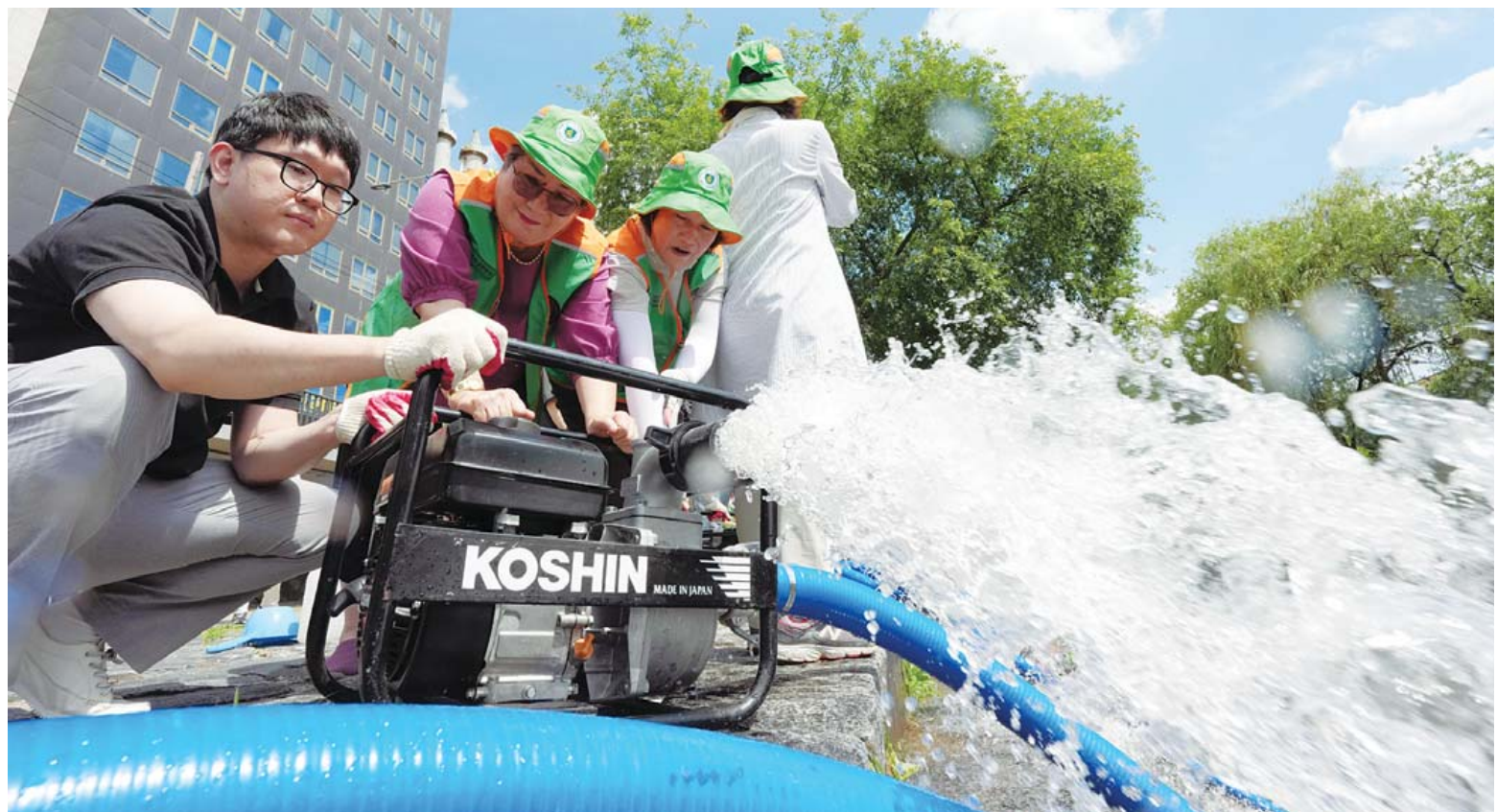
자연재난대비 양수기 가동 훈련. 여름철 자연재난대비 양수기·수중펌프 가동훈련이 9일 오후 광주 광주천 중앙대교 아래에서 열려 남구 지역자율방재단과 동행정북지센터 직원들이 양수기를 가동하는 훈련을 하고 있다.

광주진학부장협의회 가채점 결과 발표 전남대 의학과 지역인재 전형 289점 시교육청, 8월5-12일 수시 대비 상담