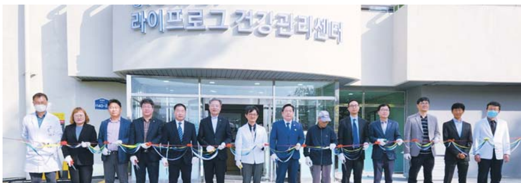
원광대 광주한방병원은 2024년 4월 병원 지하 1층에 위치한 '광주 남구 라이프로그 건강관리센터' 개소식을 가졌다. 해당 센터는 시민들의 건강 증진을 위한 AI 헬스케어 서비스 및 자가건강관리 환경을 무료로 제공한다.