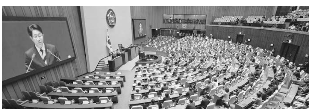
제22대 후반기 국회의장에 선출된 더불어민주당 조성희 의원이 국회에서 열린 '제436회 국회(임시회) 제1차 본회의'에서 당선 인사말을 하고 있다.