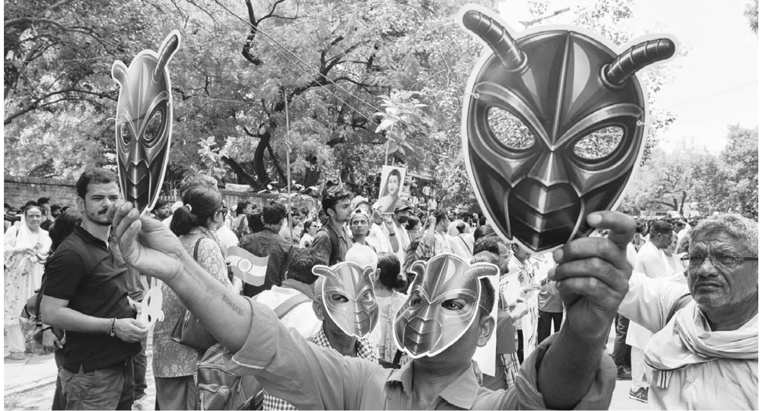
6일(현지시간) 인도 뉴델리에서 열린 바퀴벌레 자나타당(Cockroach Janta Party) 시위에서 지지자들이 마스크를 착용하고 행진하고 있다.