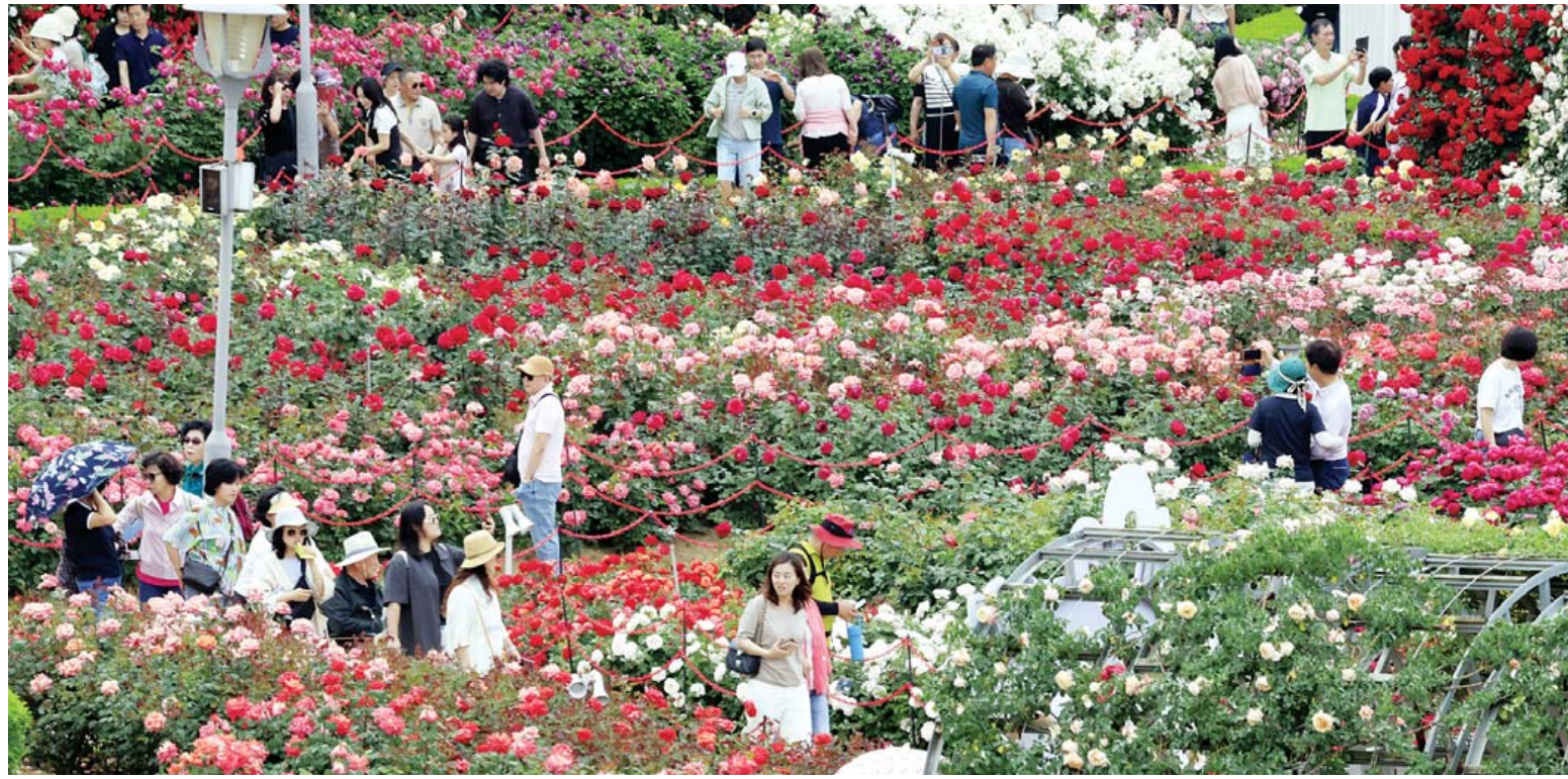
울긋불긋 장미의 유혹 곡성세계장미축제가 끝난 이후에도 불구하고 7일 오전 곡성군 삼진강기차마을에는 수많은 나들이객들이 만개한 장미꽃 사이로 신축하는 등 즐거운 휴일을 만끽하고 있다. /김애리 기자

김대중 특별시교육감 당선자는 "전남광주통합특별시교육청 출범이 한 달 앞으로 다가온 만큼 준비 과제를 꼼꼼히 점검하고 있다"며 "조직과 시스템 정비 등을 차질 없이 검토해 현장의 혼란을 줄이고 교육행정의 효율성은 높여겠다"고 말했다. /박선욱 기자