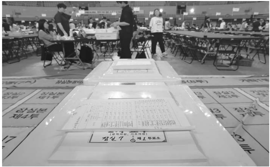
6·3 지방선거일이 하루 지난 4일 서울 올림픽공원 현대볼경기장에 마련된 송파구 개표소에 개함이 안된 잠실7동 제1투표소 투표함이 놓여 있다.

한편, 국민의힘은 전날 장동혁 상임선대위원장을 필두로 서울시 선거를 다시 치러야 한다는 주장을 폈지만, 오세훈 서울시장이 이날 오전 최종 승리를 확정 지은 이후 재선거는 더 이상 언급되지 않았다.