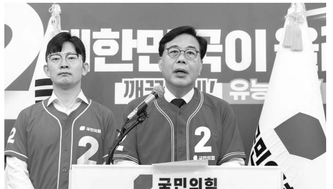
국민의힘 송인석 공동선거대책위원장이 2일 국회에서 2030 청년 투표 참여 호소문을 발표하고 있다.

장 위원장은 청양에서 유세차에 올라 “국민의 힘에 좀 실망했다고 여러분이 행사하지 않은 한 표 때문에 우리 후보들 떨어지면 땅을 치고 후회