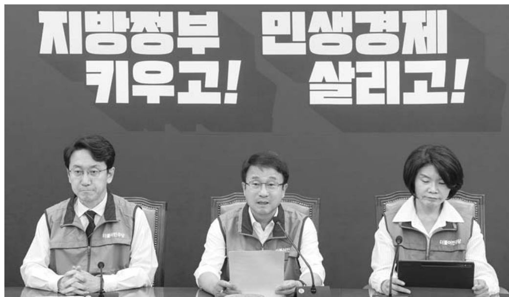
더불어민주당 한병도 원내대표가 2일 국회에서 열린 원내대책회의에서 발언하고 있다.

시킬 사람이 민주당 정청래 서울시장 후보라고 강조하는 한편, 국민의힘 오세훈 후보의 ‘실제 판 시장’을 심판해달라는 메시지를 앞세워 지지를 당부했다.