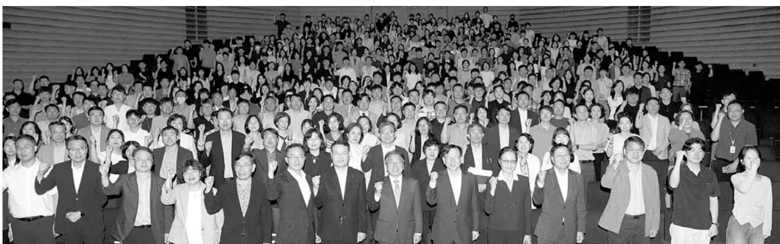
광기정 광주시장이 2일 시청 대회의실에서 열린 정례조회에 참석해 '정례조회로 돌아보는 민선 8기의 여정'을 주제로 민선 8기 4년간의 변화와 광주의 미래 가치를 공유한 후 기념촬영을 하고 있다.