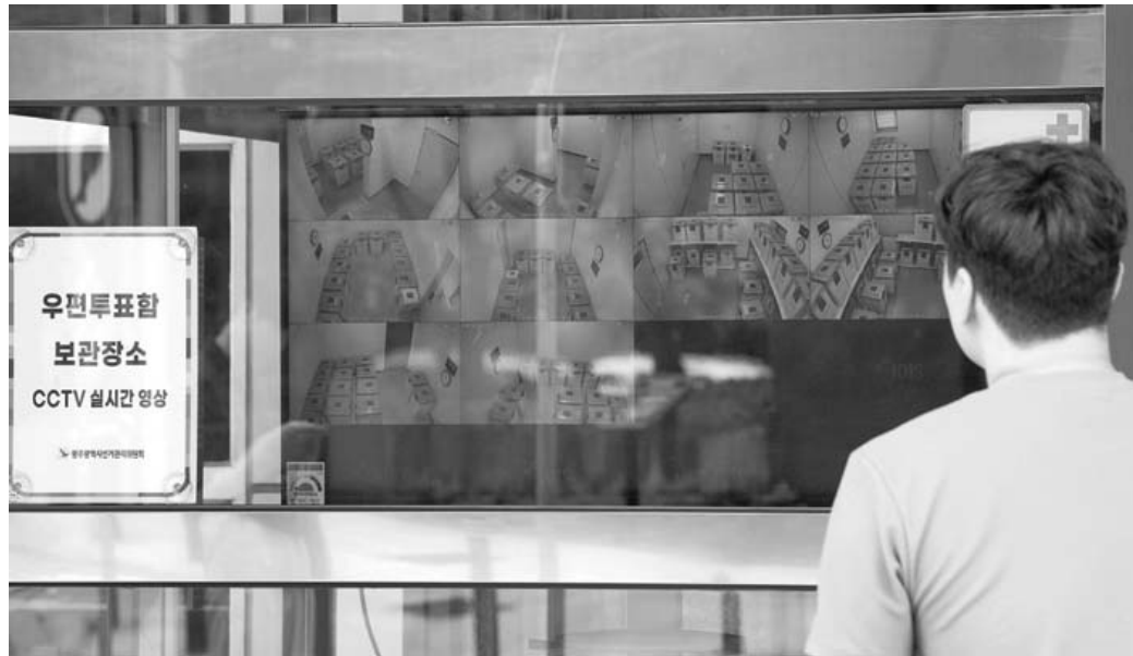
사전투표함 보관 공개 6·3 3지선 사전투표기 완료된 가운데 1일 광주 서구 치평동 광주시선거관리위원회 정문 입구에서 한 시민이 사전투표함 보관장소 CCTV를 보고 있다.

이 중 3·5·7일 머무는 관광은 직장인·가족은 3일, 실버관광객은 5일, 외국인인은 7일 머무는 전남광주특별시를 위해 스마트 통합관광관제센터 설치, NFC 기반 관광투어패스 도입, 광역 체류형