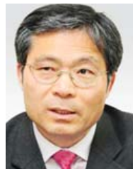
이 계 앙 광주푸른꿈창작학교 교장 몸자주자시민들 공동대표

인터네트에서 (세상에서 가장 아름다운 것들)(이태희)이라는 글을 읽었다. '세상에서 가장 아름다운 얼굴은 맨얼굴, 가장 아름다운 손은 빈손, 가장 아름다운 말은 침묵, 가장 아름다운 대화는 미소 짓는 입, 가장 아름다운 기도는 십자가 밑에 꿇어앉아 눈을 감는 것, 가장 아름다운 친구는 그리워하는 사이' 등등 하나같이 공감이었다. 그럼 세상에서 가장 아름다운 소리는 무엇일까. 어릴 적 석양 무렵에 정신없이 골목에서 놀고 있을 때 "OO야, 밥 먹어!"고 부르던 지금은 하늘나라에 계신 어머니의 목소리를 잊을 수 없다. 어머니의 목소리를 쓴 시가 있다. '어머니의 목소리다 /내가 놀던 신천동 골목 끝/땅거미 지는 저녁/밥이 쪄진 전신주/희미한 보안등 불빛 아래/행주차 마른 채로/밥 먹으러 오나라 /손짓하며 소리치던 어머니/반가운 목소리다/이제는 그 목소리를 수 없이/내가 울면서 소리친다/어머니 진지 드시러 오세요/어머니 배고프실까봐/멀리 밤하늘을 향해/달을 보고 소리친다'(「녹명(鹿鳴)」, 정호승) 녹명(鹿鳴)! 세상에 가장 아름다운 소리다. 시경(詩經) 소아(小雅) 편에 '유우녹명(鹿鳴 食野之)'이란 구절이 있다. "우·우하고 우는 사슴의 무리, 들에서 햇썩