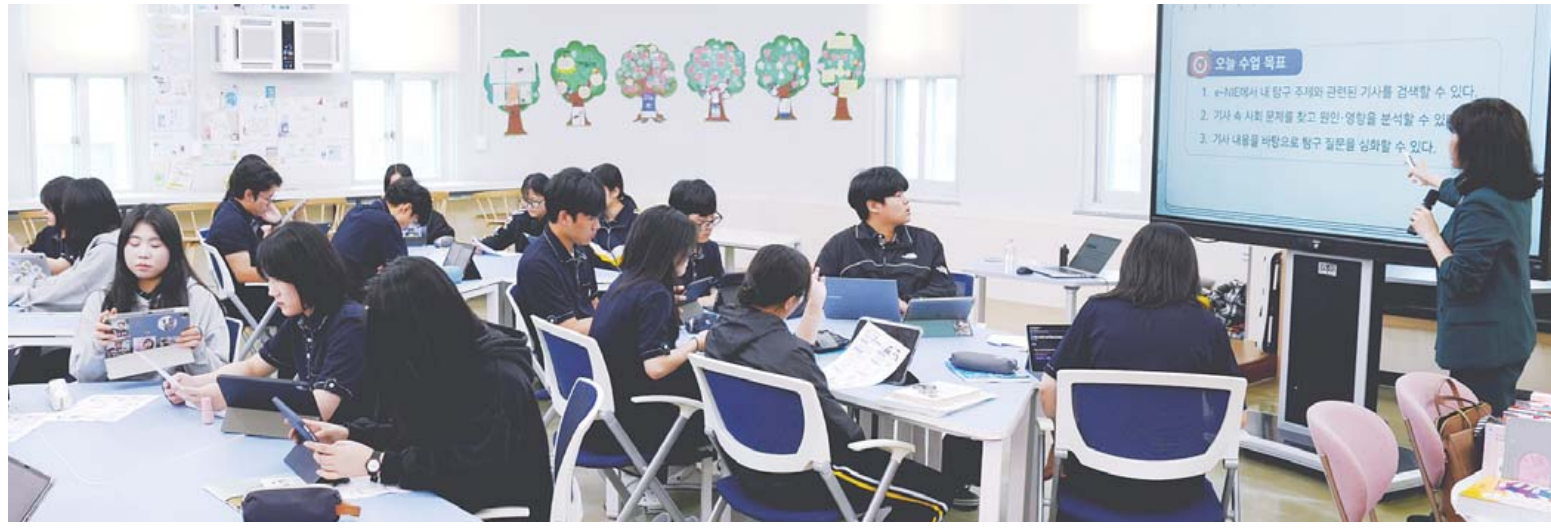
전남 지역 학생들의 생활 밀착형 독서 습관 형성과 디지털 문해력 향상을 위한 'e-NIE'(디지털 뉴스 활용 교육)가 21일 영광 해룡고에서 열렸다.

도교육청·한국언론진흥재단 협력 도내 15개교 뉴스 활용 교육 도입 독서 습관 향상·교육격차 해소 기대