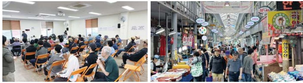
‘고유가 피해지원금’ 2차 지급 이틀째인 19일 용봉동행정복지센터(왼쪽)와 말바우 시장 전경.

소득 하위 70% 대상 15만원 지급 7월3일까지...1차 미신청자도 대상 동행정복지센터·전통시장 등 복직 전보료 기준 해당 안돼 빈손 사례도