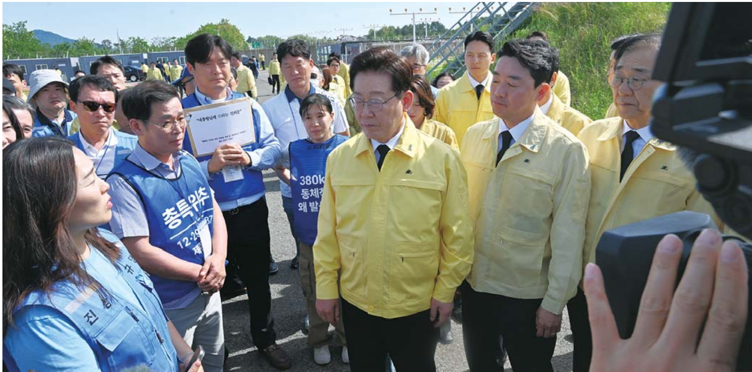
이재명 대통령이 18일 무안공항 12·29 여객기 참사 유해 수습 현장에서 유가족과 대화하며 건의문을 받고 있다.

이울러 이 대통령은 현장 유해 수습 작업이 잠정 중단된 상황에 대한 설명을 듣고 안전을 확보한 뒤 신속히 수습 작업을 재개할 것을 지