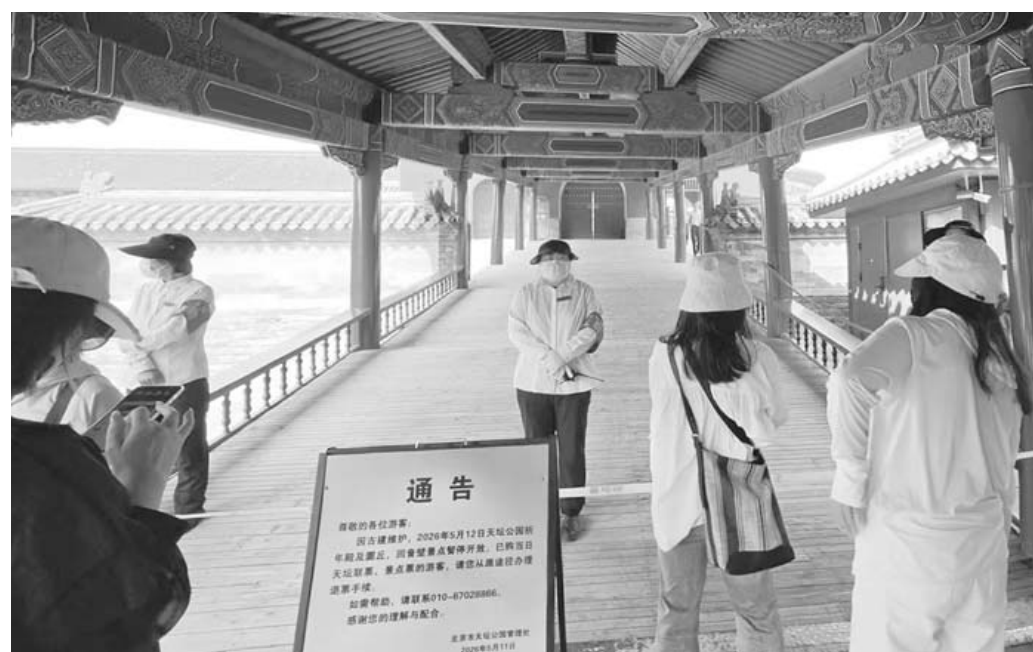
미-중 정상회담 앞두고 폐쇄된 텐탄공원 치넨텐의 입구 12일 중국 베이징 동청취 텐탄공원의 명소인 치넨텐의 입구에 폐쇄 안내판이 놓여 있다. 공원 측은 보수작업을 이유로 공원 곳곳을 통제했으며, 14-15일 이틀 동안은 공원 전체를 폐쇄한다고 말했다. /연합뉴스

협상에 큰 진전이 있다며 이틀째인 5일 중단한 바 있다. 트럼프 대통령의 발언은 이란에 더욱 큰 양보를 압박하기 위한 차원으로 보인다. 트럼프 대통령은 이란이 내놓은 종전협상안에 대해 전날 마음에 들지 않는다며 수용 불가 입장을 밝혔다. 트럼프 대통령은 전날 미 시사 프로그램 ‘풀메저’ 인터뷰에서도 이란을 2주간 공격할 수 있다고 발언했다. 2월말 시작된 대이란 군사작전 ‘장대한 분노’가 종료됐다고 봐도 되느냐는 질문에는 “나는 그렇게 말하지 않았다”고도 했다. 트럼프 대통령은 당초 13-15일 중국 방문에 나서기 전에 이란과 전쟁 종식을 선언하는 방안을 추진하면서 타결 기대감을 키우는 발언을 계속 해왔으나 현재로서는 방종 전 타결은 사실상 물 건너간 상황이다. 이에 따라 트럼프 대통령은 방종 기간 시진핑 중국 국가주석에게 이란 설득 및 압박을 요청하며 시 주석의 협조를 통한 이란 전쟁 해결을 도모할 가능성이 있어 보인다. /연합뉴스