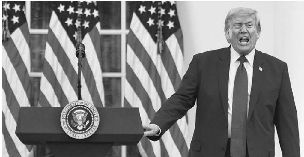
연설하는 트럼프 도널드 트럼프 대통령이 11일(현지시간) 워싱턴 백악관 로즈 가든에서 열린 경찰 주간 기념 만찬에서 행정부 구성원 및 법 집행 기관 지도자들을 위해 연설하고 있다.

가질 수 없다고 강조했다. 그는 이란이 고농축 우라늄을 미국에 넘기기로 했다가 말을 바꿨다는 주장도 했다. 트럼프 대통령은 “이틀 전에는 그랬다가 그들은 마음을 바꿨다. 문서에 명시하지 않았기 때문”이라고 했다. 트럼프 대통령은 백악관 행사 참석자들에게 발언을 너무 오래 하지 말라면서 “많은 장군들이 나를 기다리고 있다. 중요한 일이고 사랑스러운 나라 이란과 관련된 일”이라고 했다. 농담조였지만 이란에 대한 군사작전 재개 검토를 시사한 발언이기도 했다. 트럼프 대통령은 백악관에서의 취재진 문답에 앞서 이날 폭스뉴스 인터뷰에서는 중단된 ‘해방 프로젝트’(프로젝트 프리덤·Project Freedom)의 재개를 검토하고 있다고 말했다. 폭스뉴스는 트럼프 대통령의 발언을 전하면서 “트럼프 대통령은 이번에는 호르무즈 해협에