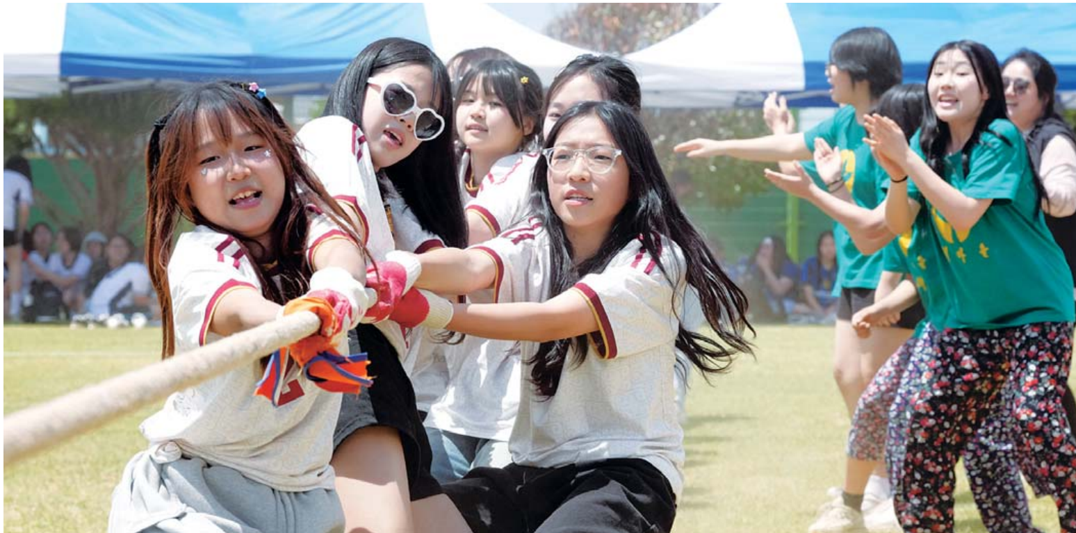
“영차~영차~” 원안한 봄날씨를 보인 11일 광주 북구 동산여중에서 체육대회가 열려 학생들이 친구들의 응원을 받으며 줄다리기엔 힘을 쏟고 있다.

박혜미 데이터정보담당관은 "AI디지털 배움터 확대와 교육 강화를 통해 시민의 AI 활용 능력이 향상될 것으로 기대한다"며 "실생활에서 바로 활용할 수 있는 체감도 높은 교육을 제공하겠다"고 말했다. /변은진기자