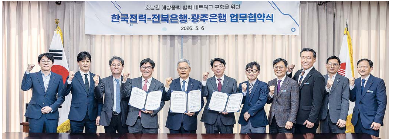
광주은행이 지난 6일 전북은행, 한국전력공사와 '지역 상생 발전을 위한 협력 네트워크 구축' 업무협약(MOU)을 체결했다. <광주은행 제공>

aT 광주전남지역본부 관계자는 "채소류는 공급 증가로 인해 싸게 판매되고 있고, 과일과 수산물은 소비 둔화로 비교적 저렴한 가격대가 형성되고 있다"며 "품목별 수급 상황에 따라 알뜰 구매 기회가 많은 시기인 만큼 가격 정보를 참고해 합리적인 장바구니를 하길 바란다"고 말했다. /안태호기자