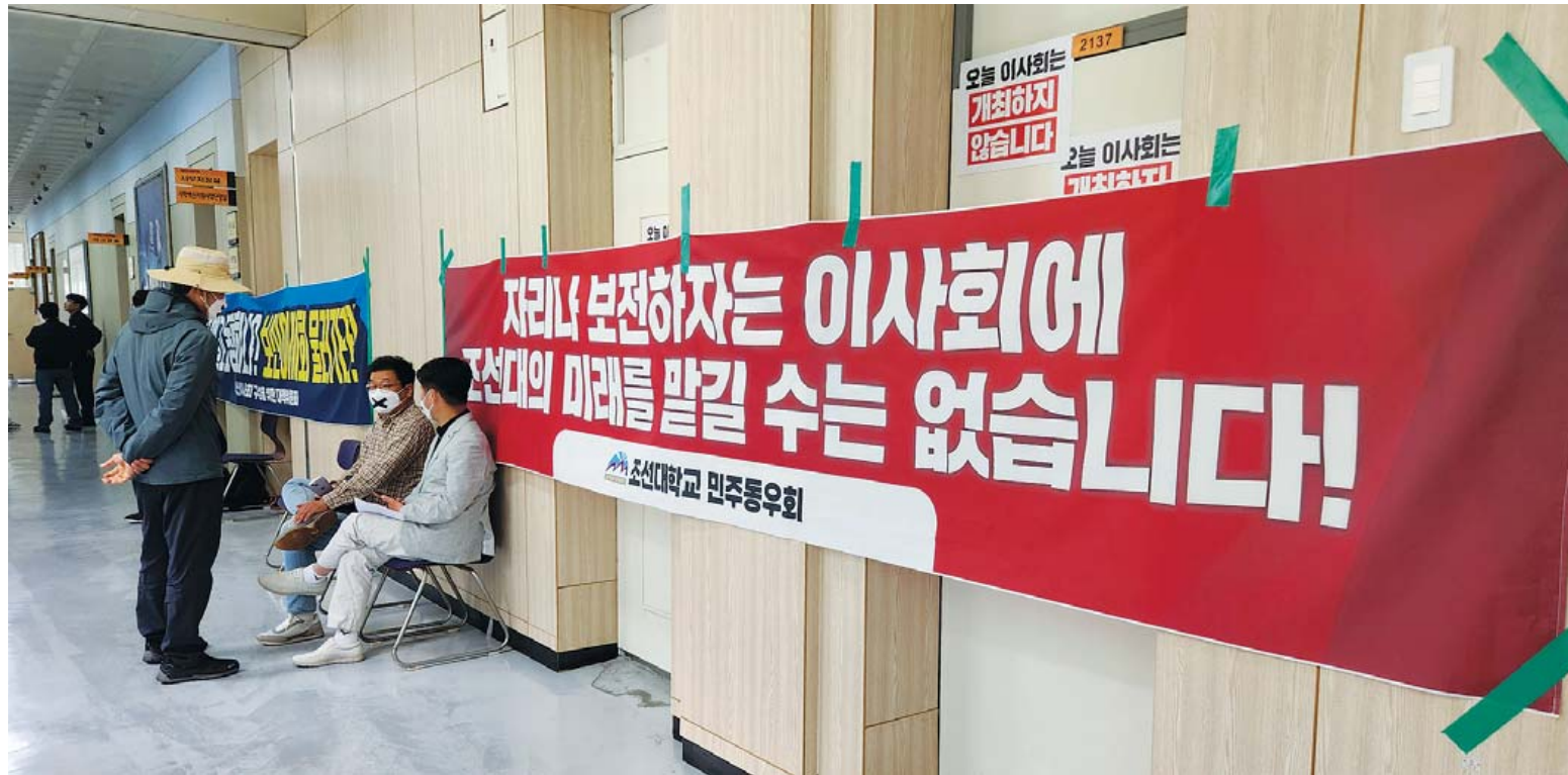
7일 조선대학교 민주동우회 대책위원회 관계자들이 대학 본관 2층 이사장실 앞에서 법인 임시이사회 개최를 막기 위해 프랑카드를 건 채 제거봉성을 하고 있다.