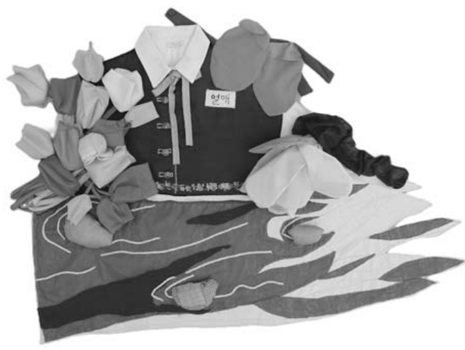
5·18 열매 × 연대예술인작 '우리들의 이야기'