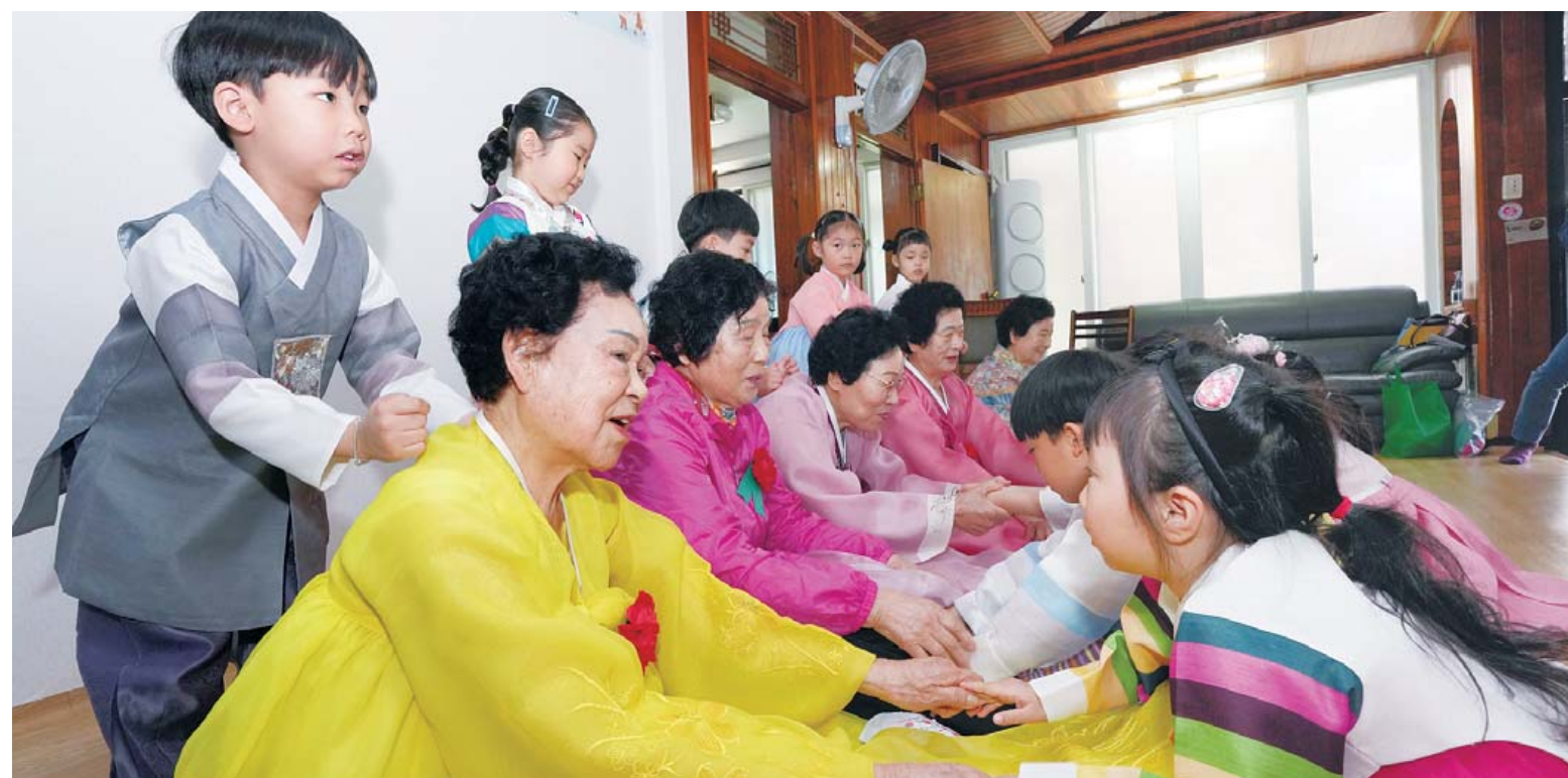
“할머니 건강하세요” 어버이날을 이틀 앞둔 6일 광주 북구청 직장어린이집 아이들이 중흥2동 경로당을 찾아 할머니들에게 케네이션을 달아 드리고 건강하시라며 어깨를 안마하고 있다.