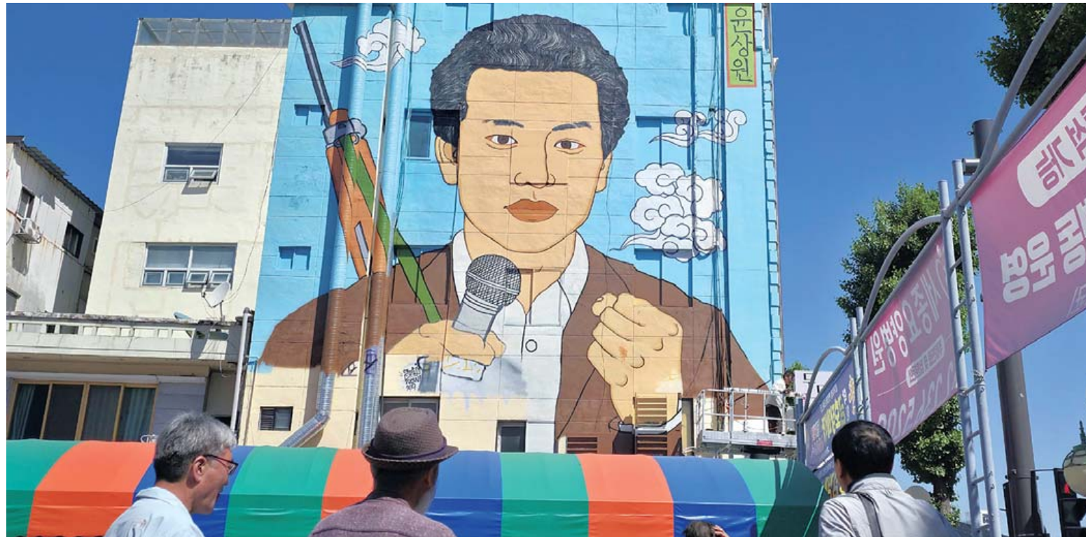
윤상원 열사 벽화 5일 오전 광주 동구 오월미술관 인근 건물에 5·18민주화운동의 상징적 인물인 윤상원 열사의 벽화가 완성되고 있다. 시민들의 모금으로 추진된 이번 벽화 작업에는 이상호 화가와 이종배 그래피티 아티스트가 참여했다.