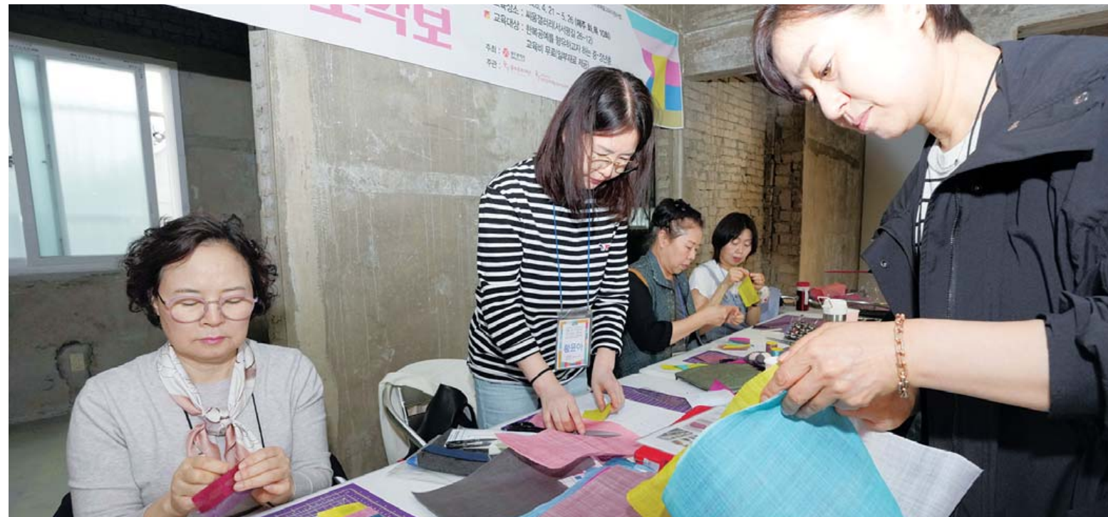
장노속 한복으로 다시 잇는 조각보

북구는 주사기 판매 및 보관 자료를 제출하지 않는 업체에는 물가안정법에 근거해 최대 과태료 1천만원을 부과할 방침이다. 또 매점매석 행위가 적발되면 관련 내용을 광주지방식약청으로 즉시 통보할 방침이다. /윤찬용 기자