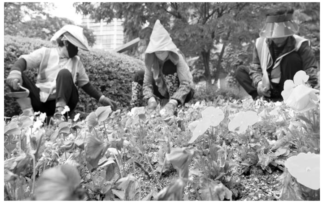
여름꽃 식재 28일 광주 북구청 광장에서 공원녹지와 직원들이 매리골드, 백일홍 등 여름꽃을 식재하고 있다. 북구는 이달 말까지 4만본의 여름꽃을 관내 가로화단에 심을 계획이다. /조영권 기자

경찰은 카메라에 찍힌 영상을 분석하고, A씨를 조만간 불러 조사할 예정이다. 광주시교육청도 사실관계를 조사하고 있다. /인재영 기자