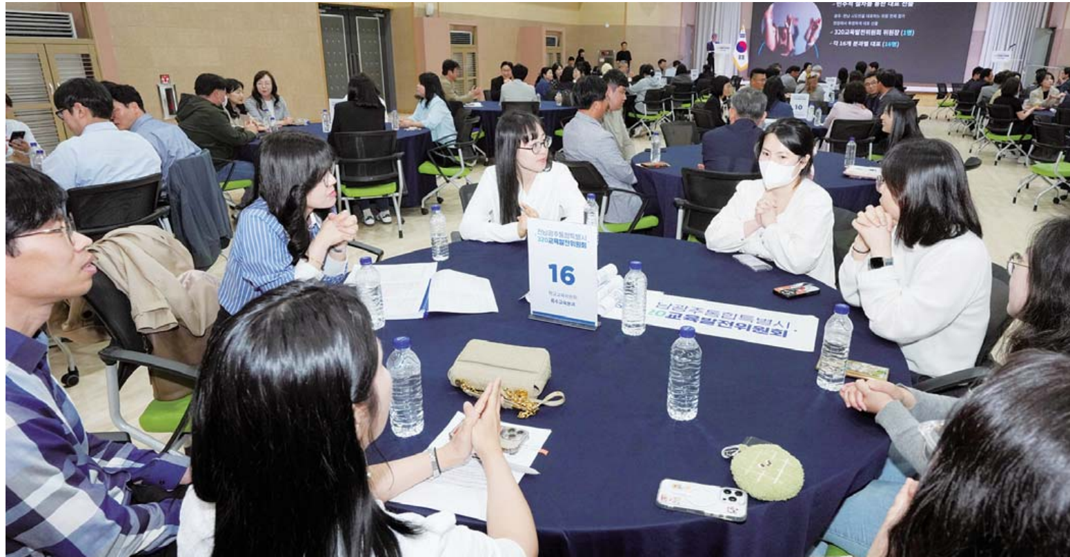
전남광주통합특별시 320교육발전위원회 광주·전남 교육 행정 통합에 따른 시·도민 의견 수렴을 위해 전남광주통합특별시 320교육발전위원회 공청회가 27일 광주A교육원에서 열린 온라인 공개 모집을 통해 선정된 학생·학부모·교직원 등 320위원회 위원들이 토론하고 있다.

전남도는 27일 “최근 중동 전쟁 여파에 따른 비상경제 상황에서 사회적 고립으로 고독사와 위기에 놓인 도민을 선제 발굴하기 위해 오는 7월까지 ‘고독사 위험군 발굴 기획조사’를 실시한다”고 밝혔다. 조사 대상은 전남 지역 1인가구 43만여명 중 체납, 자살 위험, 알코올중독, 치매 등 고독사와 연관성이 높은 위기정보 27종 가운데 1개 이상 해당하는 3만8천여명이다. 조사는 공무원을 비롯해 우리동네 복지공동체, 이웃연결단, 이·통장, 지역사회보장협의체 등 지역 인적안전망이 참여하는 민·관 협력 방식으로 추진된다. 특히 위기정보가 3종 이상 중복된 가구는 직접 방문해 실태를 확인할 예정이다. 조사 결과, 고독사 위험군으로 분류된 대상자에게는 필요한 맞춤형 예방 서비스를 연계한다. 중·고위험군은 복지·건강·돌봄 등 대상자의 생애주기별 욕구와 상황을 반영한 복지서비스를 하고 지속 관리할 계획이다. /김재정기자