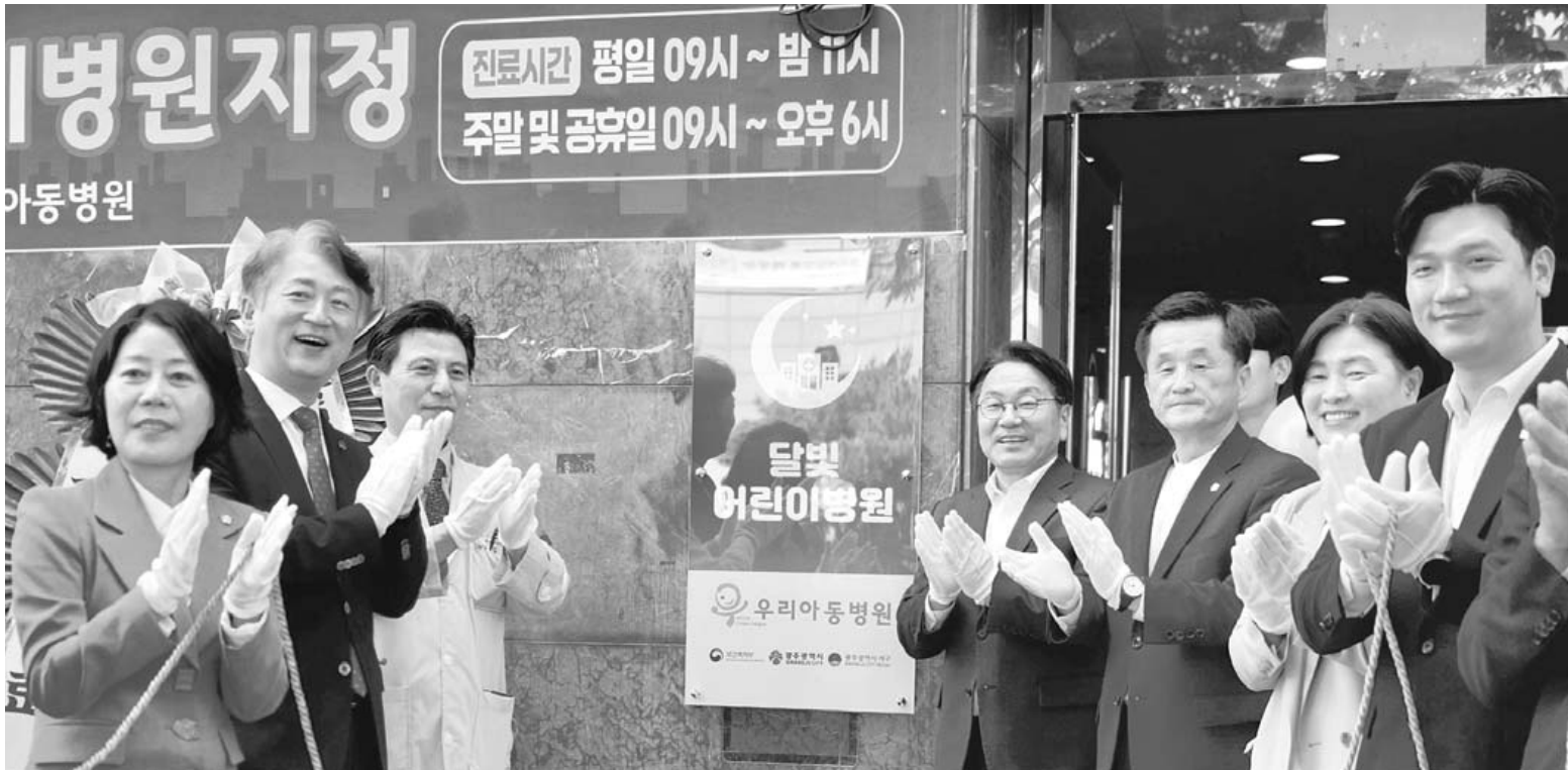
제4호 '달빛어린이병원' 개소 김기정 광주시장이 27일 광주 서구 금호동 우리아동병원에서 열린 '제4호 달빛어린이병원 개소식'에 참석해 기념촬영을 하고 있다. 한편 서구 우리아동병원은 평일은 오후 11시까지, 주말과 공휴일은 오후 6시까지 운영된다.

이를 통해 향후 4년 뒤 재인증 평가를 철저히 준비해 세 번째 재인증도 획득, 무등산권 유네스코 세계지질공원의 국제적 위상을 더욱 공고히 할 계획이다. /변은진 기자