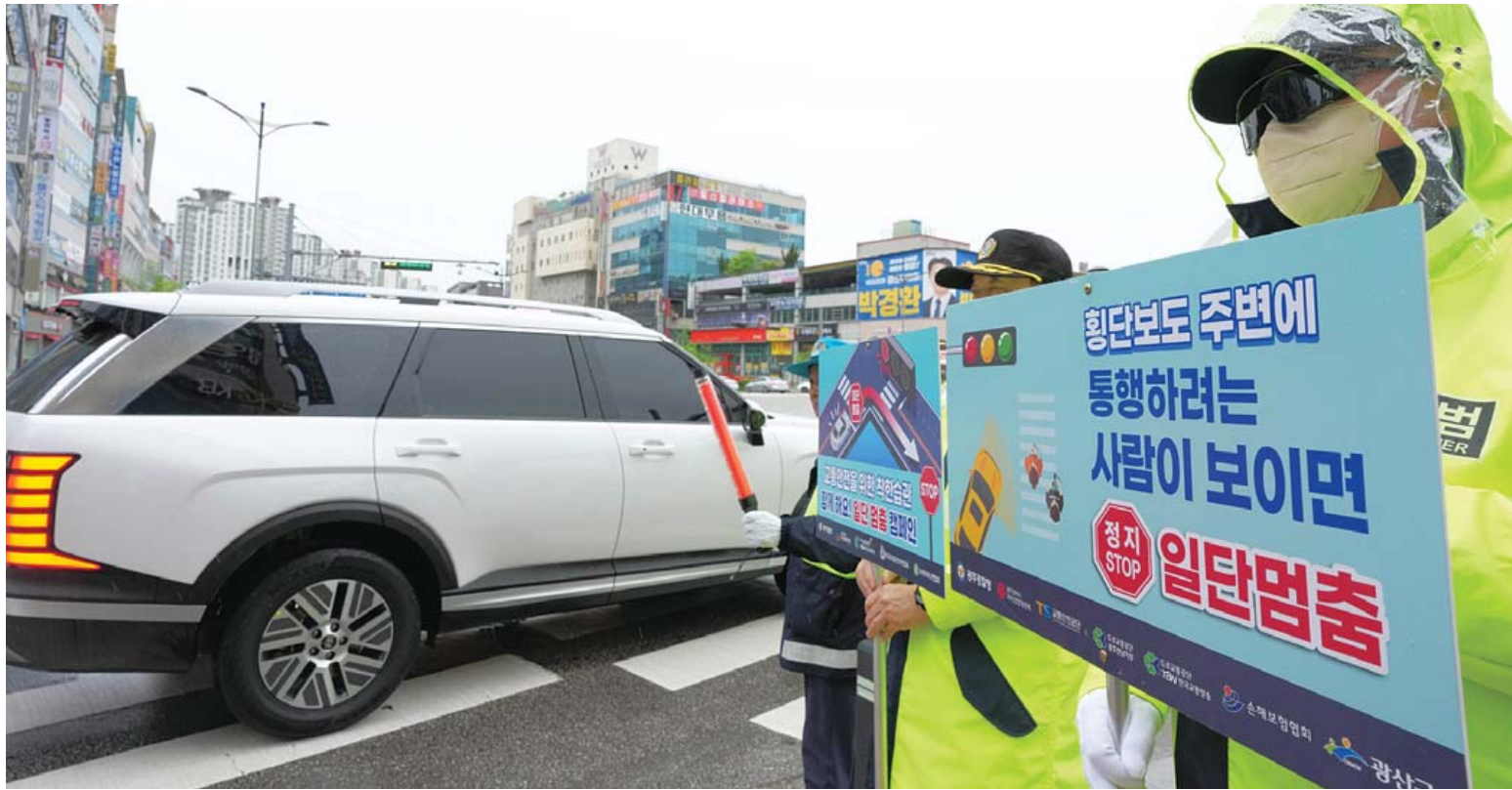
“우회전 시 일단 멈춤!” 22일 오후 광주 광산구 수완지구에서 광주경찰청과 광주모범운전자 연합회 회원들이 차량 우회전 시 보행자 안전을 위한 운행 방법을 안내하는 ‘일단 멈춤’ 캠페인을 실시하고 있다.

이어 2차 공청회에서는 제안사항 등에 대한 통합준비단의 검토·추진 경과를 공유하고, 분