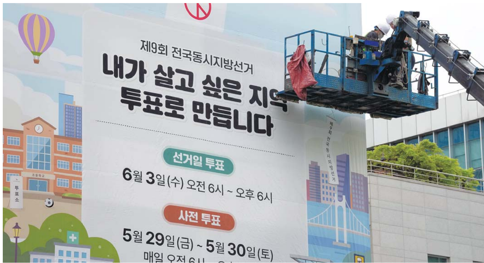
“地選 꼭 참여하세요” 6·3 지방선거가 42일 앞으로 다가온 22일 오전 광주시선거관리위원회에서 시민들의 투표를 독려하는 메시지가 담긴 홍보 플래카드를 외벽에 걸고 있다. 한편 이번 전국동시지방선거 사전투표는 5월29~30일 이틀간 실시된다.

광주 동구청장 선거는 2018년 지방선거에 이어 8년 만에 전·현직 구청장 간 리턴매치가 성사됐다. 현직인 민주당 임태 후보와 전직 청장인 조국혁신당 김성환 후보가 맞대결한다. 현직 프리미엄과 조직력을 앞세워 3선에 도전하는 임