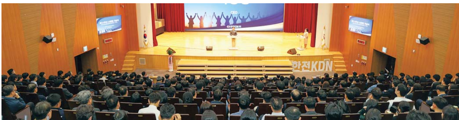
에너지ICT 전문 공기업 한전KDN이 최근 광주전남공동혁신도시 소재 본사 빛가람홀에서 '창립 제34주년 기념식'을 개최했다.