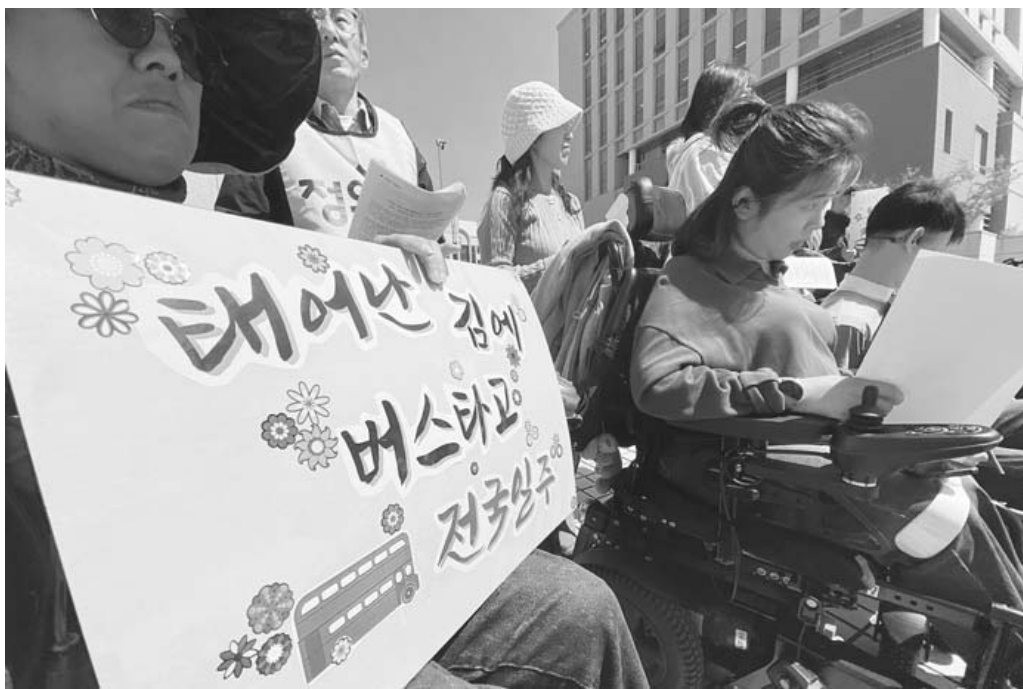
전국장애인이동권연대 전남지부와 전남장애인차별철폐연대는 21일 오후 2시 광주지방법원 앞에서 기자회견을 열어 휠체어 이용자의 시내버스 탑승을 위한 리프트 설치 등 이동권 보장을 촉구했다.

“재판부는 오늘 제기된 이 소송을 진행해 대한민국이 장애인의 이동권을 보장할 수 있도록 해야 한다”며 “버스회사에게 면죄부를 주