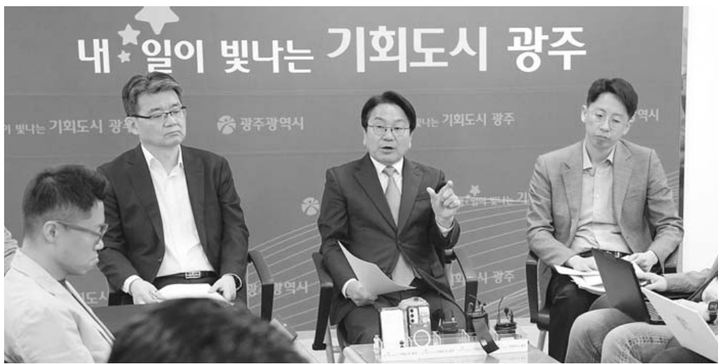
강기정 광주시장이 21일 기자자담회를 열어 행정통합 추진 과정과 주요 시정 현안을 설명하며 임기 말 시정 마무리에 집중하겠다는 입장을 밝히고 있다.

姜시장 "정부 기조 변화에 사업 탄력" "기부 대 양여·개발 동시 추진 공감대" 통합특별시금고 선정도 공정하게 진행