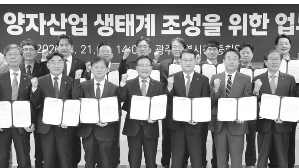
광주·전남 양자산업 생태계 조성 업무협약이 21일 광주시청 중회의실에서 열려 대학, 연구기관, 기업 등 23개 기관 등 참석자들이 업무 협약을 체결한 뒤 기념촬영을 하고 있다.

지·산·학·연 23개 기관 협약 초광역 협력 'K-퀀텀 클러스터' 유치 총력...기술 개발