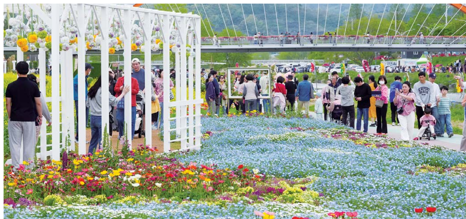
봄꽃 사이로 여유로운 발길 19일 오전 화순 꽃강길 일원에서 ‘봄꽃 여행(夜行)’을 주제로 화순 봄꽃 축제가 열려 관광객들이 화려하게 꾸민 꽃길을 걸으며 봄의 정취를 느끼고 있다. > 관련기사 10면