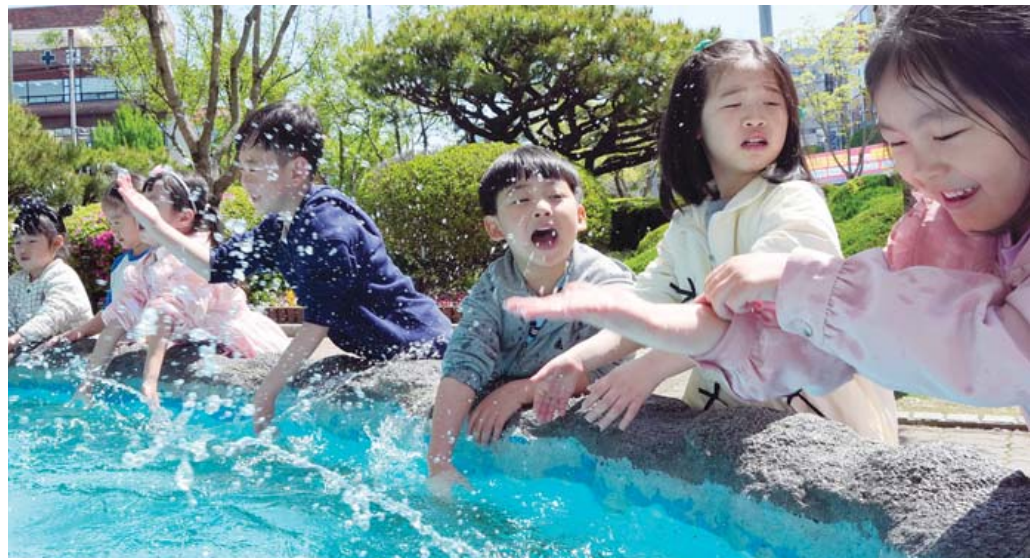
'벌써 여름?' 한낮 최고기온이 28도를 넘어며 초여름 날씨를 보인 16일 광주 북구청직장어린이집 아이들이 구청 광장 물레방아에서 물놀이를 하며 이른 더위를 식히고 있다.