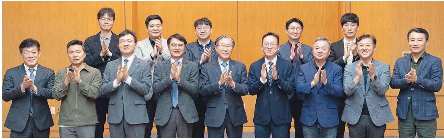
광주과학기술원(GIST)과 기아가 지난 15일 GIST 행정동 대회의실에서 미래 모빌리티 협력 심포지엄을 개최한 가운데 참석자들이 기념촬영을 하고 있다.

최근 '전략적 협력 심포지엄' 개최 "AI·센서 기반 연구·실증·인재 양성" '수소 운용차 전환' 3단계 협력 구상도