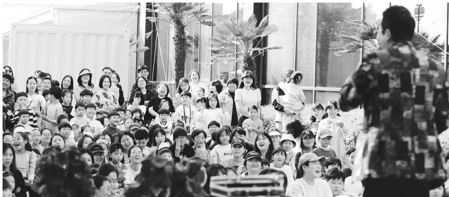
지난해 5월 국립해양유산연구소와 협력해 개최한 어린이날 축제에서 방문객들이 공연을 즐기고 있다.

단방향 전시 탈피 복합공간 개편 리뉴얼 후 年 관람객 25만 돌파 야외에 '아트테이먼트파크' 구축 서남권 대표 체류형 관광지 거듭