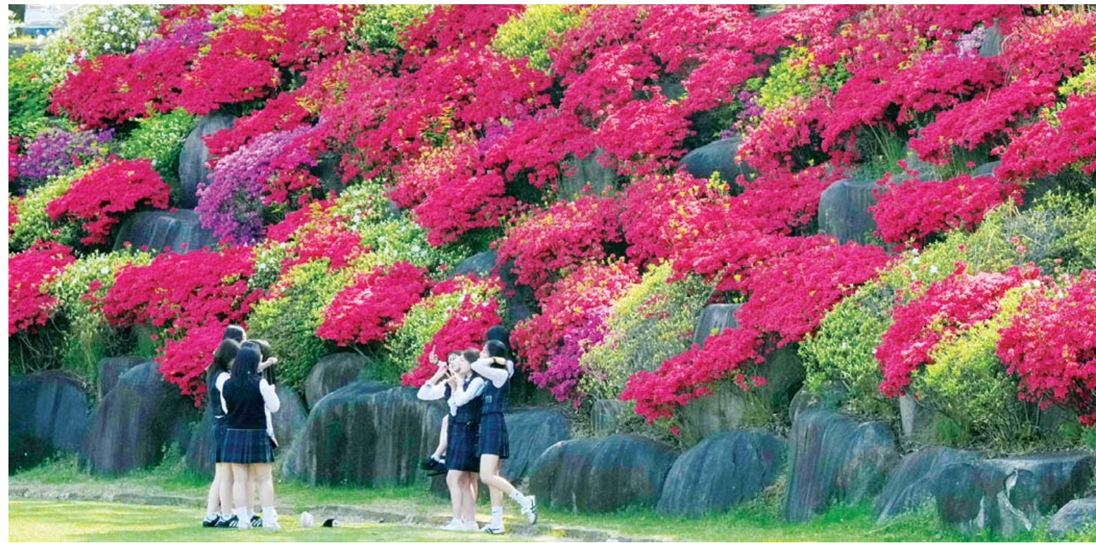
활짝 핀 철쭉 앞 추억의 한컷. 한빛 최고기온이 25도를 넘으며 봄 감지 않은 날씨를 보인 15일 오전 광주 북구 동강대학교 운동장에서 만개한 철쭉을 배경으로 학생들 이 사진을 찍으며 추억을 남기고 있다. /조영권기자

전국농민회총연맹 광주시농민회가 중동 전쟁 여파로 인한 생산비 급등을 지적하며 농업 예산 확대와 직접 지원을 촉구했다. 광주시농민회는 15일 광주시청 앞에서 기자회견을 열어 "원유와 비료 등 농자재 가격 급등으로 농민 생존권이 위협받고 있다"고 밝혔다. 이들은 "정부가 26조2천억원 규모 추경을 편성했지만 농업 대응 예산은 약 2천600억원으로 1% 수준에 그쳤다"며 "생산비 폭등에 중앙정부의 직접적인 지원이 필요하다"고 주장했다. 이어 "농업용 면세유 가격이 상승하고 비료·말칭비닐 등 주요 자재 가격도 전경 이전보다 30% 이상 올랐다"며 대책 마련을 요구했다. 그러면서 "광주·전남 행정통합 논의 속에서도 농민들의 권리 보장이 핵심 과제다"며 "정당권과 지자체가 보다 적극적으로 나서 실질적인 대책을 마련해야 한다"고 강조했다. /윤찬용기자