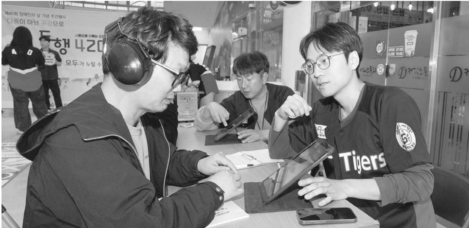
청각 장애 간접 체험 제46회 장애인의 날 기념 주간행사가 열린 15일 오후 광주 동구청 1층 로비에서 시민들이 입 모양을 보고 단어를 맞추는 청각 장애인 간접 체험을 하고 있다. 장애인의 날(4월20일)은 장애인에 대한 이해와 장애인의 재활 의욕을 고취하기 위한 목적으로 제정된 법정기념일이다. /조영권 기자

정광선 보건복지국장은 "지역 의료 공백 방지는 더 이상 미룰 수 없는 과제"라며 "취약지도민이 어디서든 안심하고 진료 받도록 최선을 다하겠다"고 밝혔다. /양서원 기자