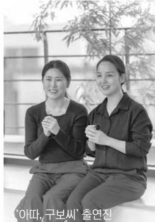
'아파, 구보씨' 출연진