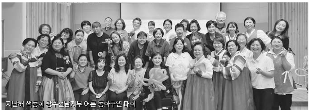
지난해 색동회 광주전남지부 어른 동화구연 대회

연주회는 전석 초대로 진행되며, 공연 문의는 010-4009-2224로 하면 된다. /최명진기자