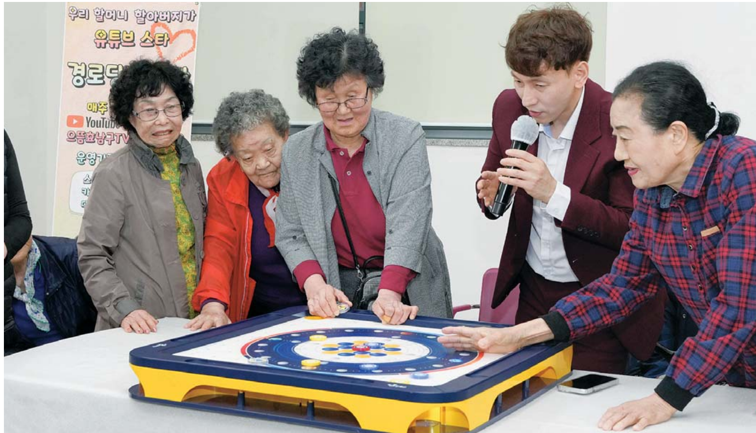
"경로당아 놀자" 광주 남구 경로당 활성화 사업인 '경로당아 놀자'가 14일 오후 남구노인복지관에서 열려 어르신들이 '알리고 보드게임'을 하며 즐거운 시간을 보내고 있다.