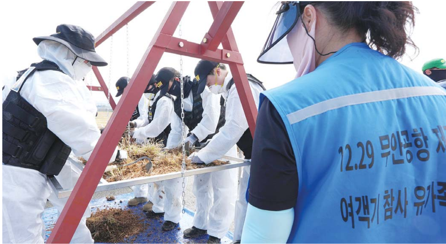
13일 무안국제공항에서 경찰과학수사대가 12·29 제주항공 여객기 참사 미수습 유해를 찾기 위해 재수색하고 있다.

민·관·군·경 범정부 차원 약 250명 투입 내달 29일까지 6개 구역...육안 확인 후 굴도→채치기...토양 상태 달라 매뉴얼必 유가족 "수립 미비·미공유"...작업 중단