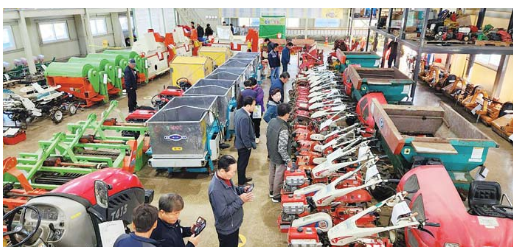
함평군은 최근 농기계임대사업소 본점에서 관내 농업인을 대상으로 불용 임대 농기계 매각을 위한 현장 판매 입찰을 진행했다.

함평군은 12일 "내구연한이 초과된 불용 임대 농기계를 지역 농가에 직접 매각하는 현장 판매를 추진하며 영농비 부담 완화와 자원 재활용에 나선다"고 밝혔다. 함평군은 지난 10일까지 농기계임대사업소 본점에서 관내 농업인을 대상으로 불용 임대 농기계 매각을 위한 현장 판매 입찰을 마감하고, 13일 공개 개찰을 진행한다. 매각 대상은 농업기술센터에서 임대용으로 사용하다 사용 기한이 지나거나 내구연한이 초과해 불용 처리된 장비들로, 소형 트랙터와 관리기 등 영농 현장 활용도가 높은 품목 위주로 구성됐다. 군은 고가의 기계 신규 구입이 부담스러운 농가의 현실을 고려해 폐기 대신 간단한 수리와 정비를 거쳐 충분히 재사용이 가능한 기종만 엄선해 이번 판매에 부쳤다. 입찰은 농업인들이 현장에서 기계 상태를 직