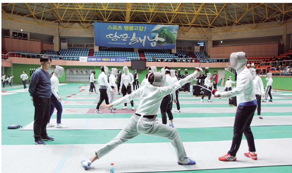
'제55회 회장배 전국남녀종별펜싱선수권대회'가 오는 15-24일 열흘간 해남읍 우슬국민체육센터 일원에서 열린다. 사진은 해남 동계전지훈련 펜싱종목 훈련 모습.

해남군이 국내 최대 규모의 전국 단위 펜싱선수권대회를 유치해 체류형 스포츠 마케팅을 통한 지역 상권 활성화에 나선다. 12일 해남군에 따르면 오는 15-24일 열흘간 해남읍 우슬국민체육센터 일원에서 '제55회 회장배 전국남녀종별펜싱선수권대회'를 개최한다. 이번 대회는 초등부부터 중·고등부, 대학부, 일반부, 실업부까지 전 종별 581개팀, 4천여명의 선수단이 참가하며, 연인원 기준 대회 기간 총 2만1천여명의 체류 방문객이 지역을 찾을 것으로 예상된다. 군은 대규모 선수단과 방문객의 체류형 소비를 유도하기 위해 경기장 안전 관리 및 숙박·음식업소 연계 지원에 집중한다. 더불어 대회 기간 중 해남매일시장 청년몰 등과 연계한 '키링 만들기 체험 프로그램'을 실시