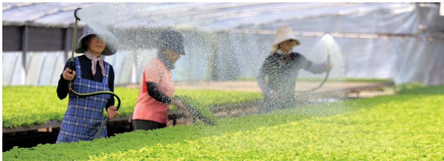
영농철...출하 앞둔 모종 따뜻한 날씨 속 본격적인 영농철을 맞은 12일 나주시 산포면 한 육묘장에서 관계자들이 출하를 앞둔 고추와 배추 모종에 물을 주고 있다.

차세대에너지연구소 산하 공동 개소 현장 적용 실증·평가 연구 중점 추진 ‘RE100산단’ 연계 운영 효율 향상도