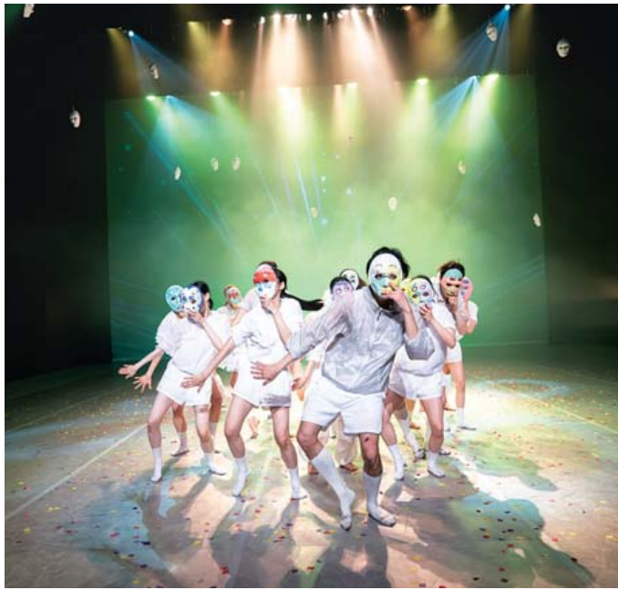
어린이무용극 ‘탈출’(왼쪽)과 창작 서커스 ‘해피 해프닝’