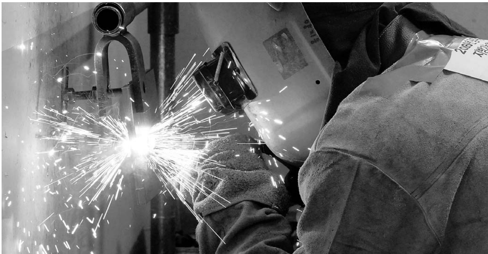
'뜨거운 불꽃' 만큼 집중 6일 오후 광주기능경기대회가 열린 북구 매곡동 광주공업고등학교 경기장에서 참가자들이 그동안 갈고 닦은 기량을 뽐내고 있다. 숙련 기술인들의 경연장인 이번 대회는 총 33개 직종 280명의 선수가 참가해 오는 10일까지 11개 경기장에서 열띤 경쟁을 펼친다.