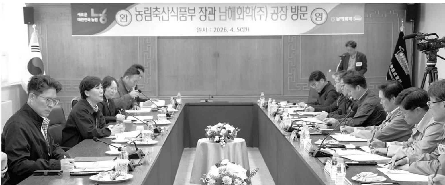
송미령 장관, 여수 남해화학 방문 송미령 농림축산식품부 장관과 황기연 전남지사 권한대행이 5일 남해화학 여수공장을 방문, 중동사태에 따른 원료(농업용 요소) 수급 동향 및 비료 생산 현황을 점검하고 애로사항을 청취하고 있다.

더불어민주당 광주 기초단체장 후보 경선 결과, 현직이 불출마한 북구를 제외하고 동·서·남·광산구 4개 자치구 모두 현 단체장이 후보로 선출돼 현직 초강세 양상이 뚜렷했다. 5일 민주당 광주시당 선거관리위원회에 따르