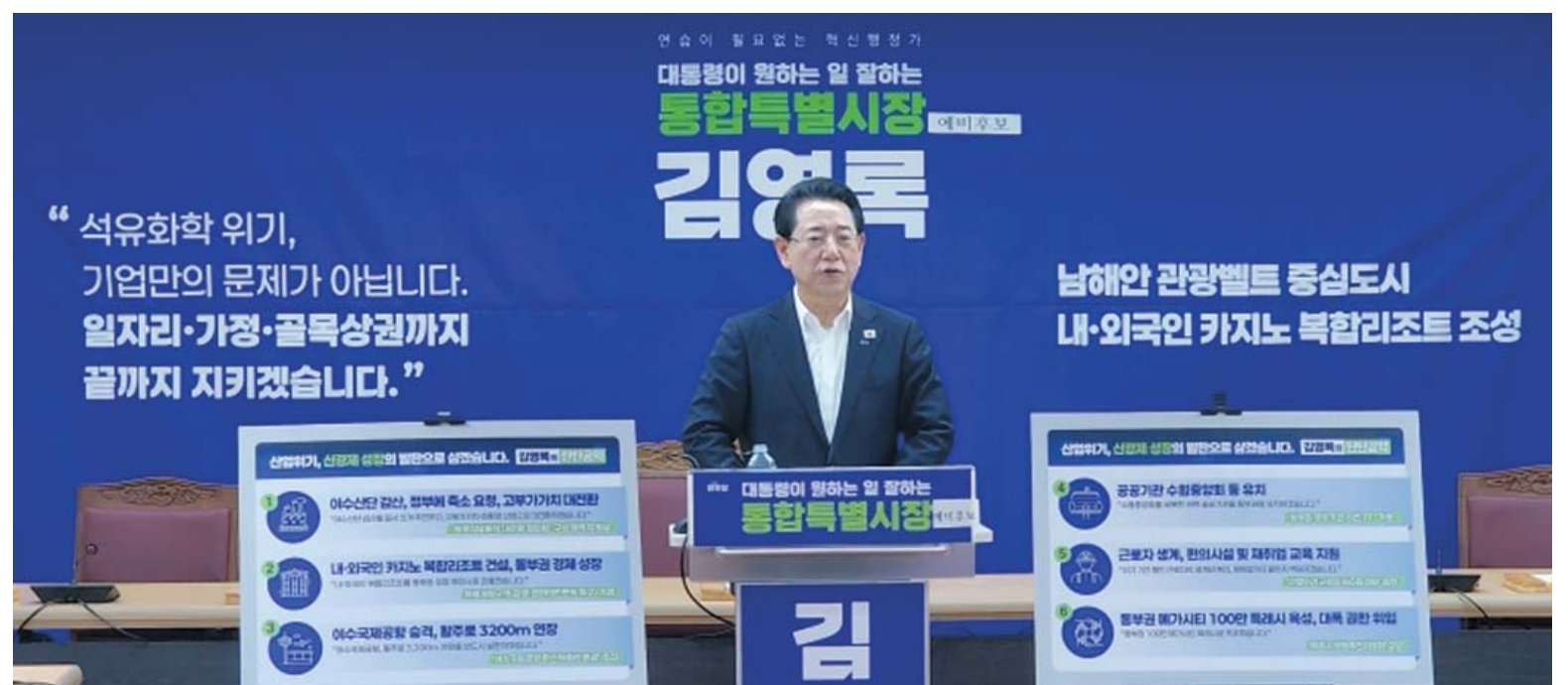
더불어민주당 김영록 전남광주통합특별시장 예비후보(전남지사 직무정지)가 2일 오후 여수시의회에서 현장 기자회견을 열고 여수 산업위기와 관광전환 동시 해법을 제시하고 있다.

이 밖에도 전남지체장애인협회원, 광주전남수의사협회원, 광주가정어린이집 5개구 지회장단 등 사회·직능단체 회원들과 재광 고향 출신 인사 등이 김 후보 경선 사무소를 찾아 지지의사를 밝혔다. /변은진·양시원기자