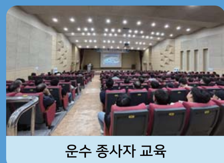
운수 종사자 교육