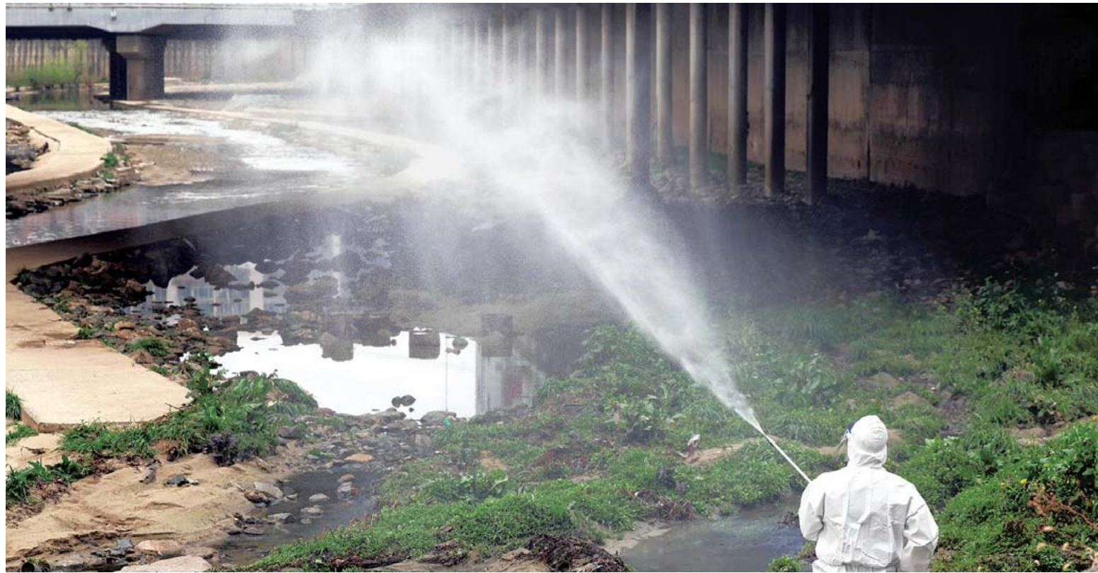
모기 매개 감염병 예방 방역 1일 광주 북구보건소 감염병관리팀 직원들이 임동 서방천 일원에서 모기로 인한 각종 감염병 예방을 위해 방역을 실시하고 있다.

두 교육청은 “이번 통합이 아이들에게 더 넓은 미래를 열어주는 생존을 위한 결단임에도 정작 통합의 동력이 돼야 할 교육재정 지원 논의는 안갯속에 머물러 있다”며 재정 지원 필요성을 역설했다.