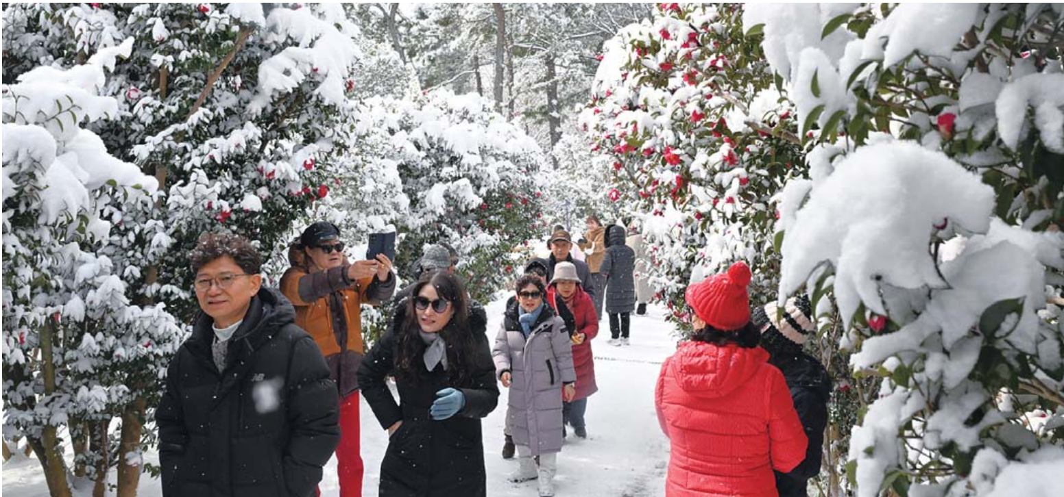
눈속에 피어난 붉은 자태 광주·전남에 눈이 내린 11일 신안군 압해도 1004섬 분재정원 애기동백 숲길에 눈 속에서 피어난 붉은 동백이 나들이객들의 눈길을 사로잡고 있다. 동백은 12월부터 꽃을 피우기 시작해 1월 절정을 맞고 3월까지 붉은 자태를 이어간다.

질의서에는 ▲교육 주체(교원·학부모·학생)의 동의 없는 일방적 통합 논의 중단 ▲교원 인사 현행 학군을 유지하는 ‘인사 구역 분리’의 법제화(특별법 명시 등) ▲교육 재정 독립성 확보