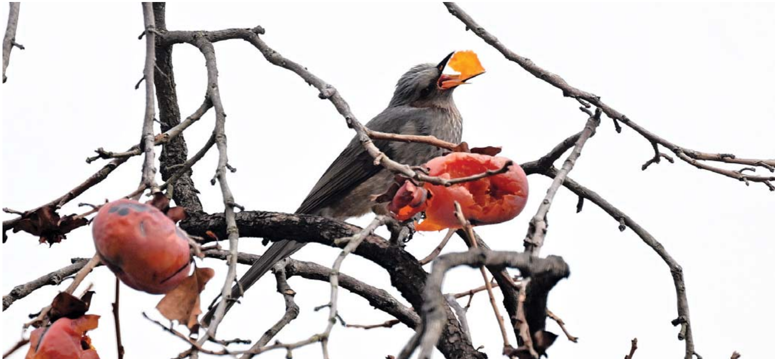
까치밥 먹는 직박구리 30일 오전 광주 남구 양림동의 한 주택에 남겨진 까치밥을 직박구리가 쪼아 먹고 있다.