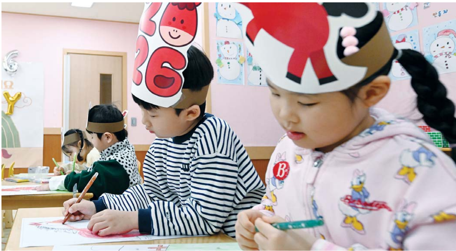
“병오년 맞아 말그림 그려요” 2026년 병오년(丙午年) 붉은 말의 해를 사을 앞둔 29일 광주 북구청직장어린이집에서 아이들이 머리띠를 쓰고 말 그림에 붉은색을 칠하고 있다. /김애리 기자

한편, 우수 운영기관에는 가천대학교 이갑여 암당뇨연구원(최우수기관)과 (주)한국비앤아이, GIST 3개 기관이 선정됐다. /박선옥 기자